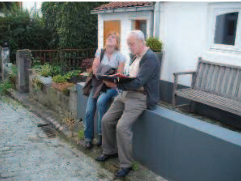
> Visite de Bruxelles avec ses habitants.