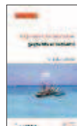
i Expansion du tourisme : gagnants et perdants, CETRI, Paris, 2006

Une grande variété d'associations et de réseaux partagent ces constats critiques et en font la raison de leur mobilisation pour la promotion d'expériences touristiques respectueuses des gens et de l'environnement. Force est de reconnaître cependant que la tendance, sans véritablement peser sur les orientations du tourisme mondial, doit aussi faire face à ses propres limites : élitisme, autolabellisation, récupération commerciale... À quelles conditions dès lors l'expansion touristique pourrait-elle induire autre chose qu'« un nouvel usage occidental du monde » ? La réponse réside d'abord dans les capacités de canalisation dont les États sont ou devraient être dotés, et dans l'implication des populations concernées dans la définition des projets et le partage des avantages. Sous l'égide d'organismes internationaux démocratiques et d'appareils de régulation négociés et contraignants, des politiques coordonnées pourraient contribuer à renverser l'actuel rapport coûts / bénéfices du secteur. Et partant, participer effectivement au « développement » des pays du Sud.