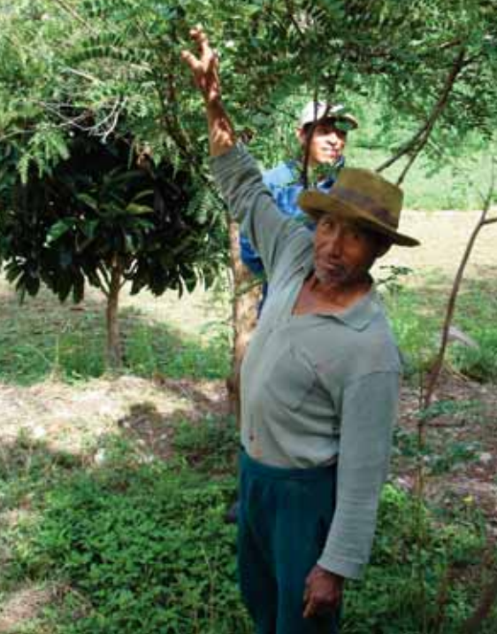
Arbre de tara

A u Pérou, nous travaillons à la formalisation et à la «capacitación» (formation qualifiante) d'organisations de producteurs en privilégiant les dynamiques collectives. Pour ce faire, nous accompagnons des producteurs de la région d'Ayacucho et de Cajamarca dans l'apprentissage d'une production rentable qu'est la tara (une gousse provenant d'un petit arbre originaire des Andes et servant au tannage du cuir ainsi qu'à l'industrie pharmaceutique).