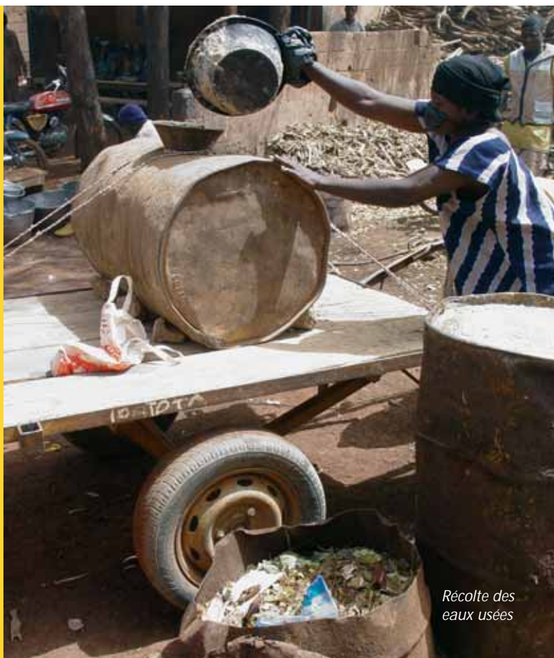
Récolte des eaux usées