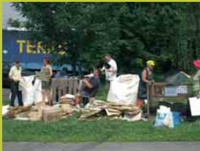
Récolte et tri de radiographies