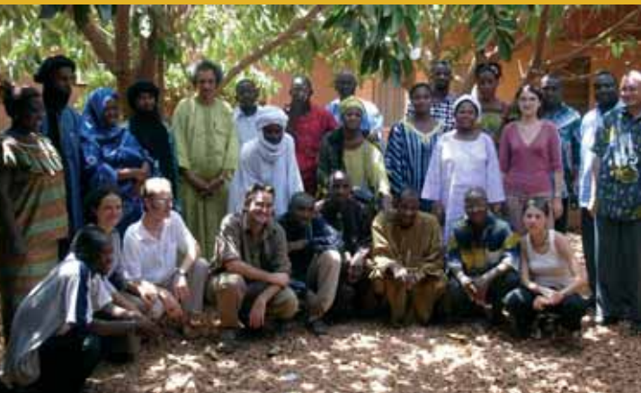
Autre Terre, lors d'un atelier de réflexion commencé au Sud...

2006 a été une année charnière dans la vie de l'ONG Autre Terre.