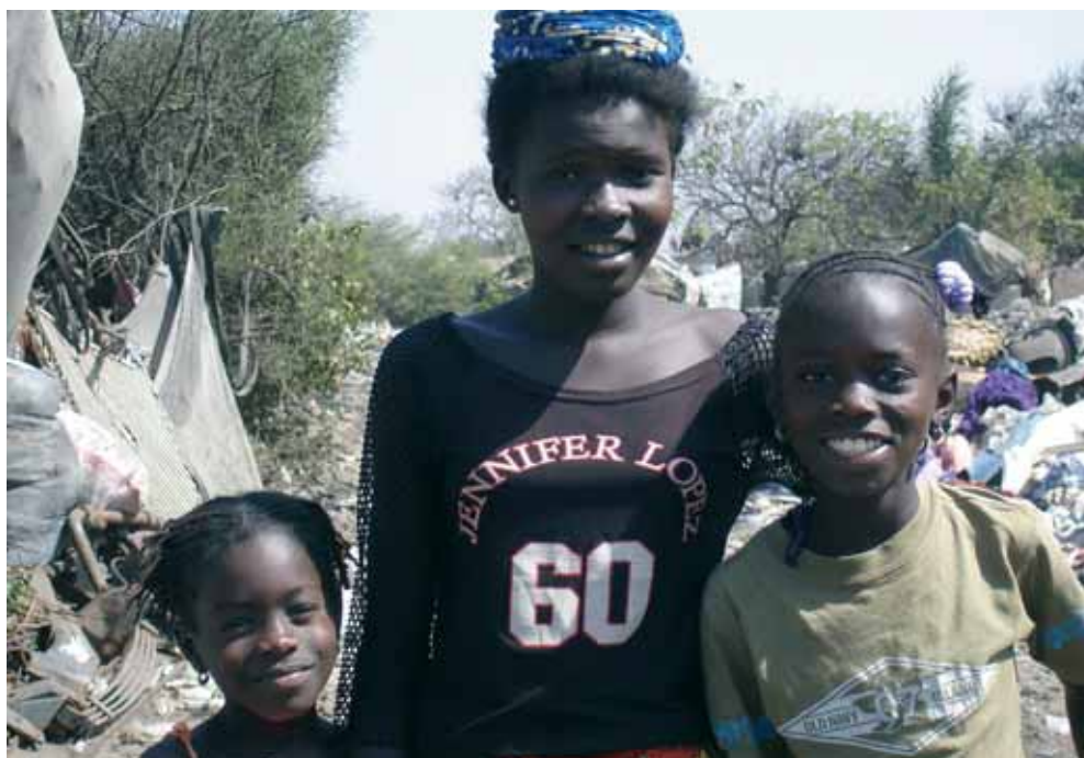
Objectif de Book Diom : améliorer les conditions de vie des membres à travers la mise en place d'activités socioéconomiques.

Le partenariat Autre Terre/Book Diom prend fin au terme de l'année 2007.