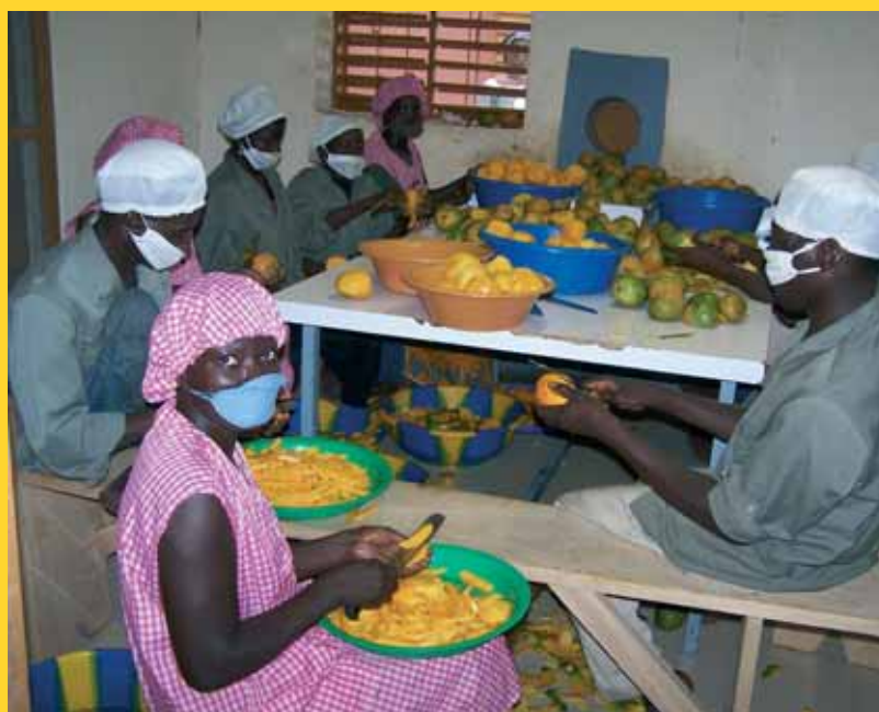
Unité de séchage de mangues à Bobo-Dioulasso

mangues dans les vergers début août. En ce qui concerne la commercialisation, ECLA a privilégié le séchage de mangues certifiées bio, ce qui augmente leur prix d'achat (au profit des producteurs de la région de Toussiana et Orodara) mais aussi leur prix de vente une fois transformées. La vente a été importante en 2006 (15.358 kg) et a été réalisée avec une seule société locale (Gebana Afrique sarl). Le reste de la production (surtout du 2 e et 3 e choix, impropre à l'exportation en Europe comme «produits de bouche») a été vendu localement. Pour financer cette campagne, ECLA a eu recours à un emprunt important, à court terme, auprès d'une nouvelle banque de la zone : la Banque Régionale de Solidarité.