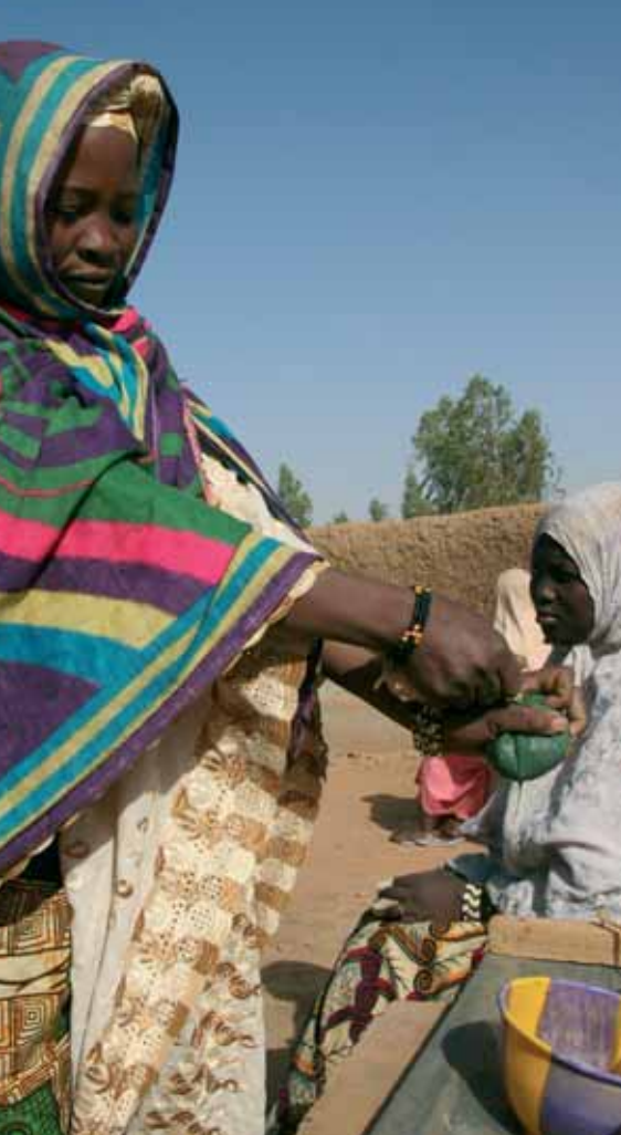
Extraction de la spiruline*

de renforcer les actions menées autour du maraîchage et de l'élevage. Une petite unité de production de spiruline* (5 bassins et acquisition de tout le matériel nécessaire) a également été installée au sein de l'association Assaghsal (organisation composée d'une quarantaine de femmes) et commencera à produire en 2007.