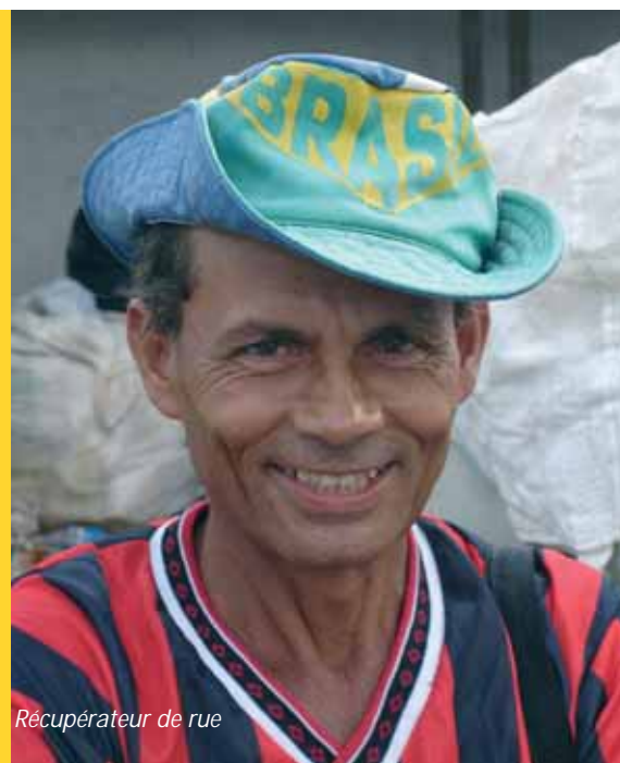
Récupérateur de rue

L'année 2007 sera la poursuite de ce qui a été entrepris en 2006 en termes de formation des récupérateurs et d'orientations méthodologiques au gouvernement local responsable de la mise sur pied de ce programme communal de collecte sélective solidaire.